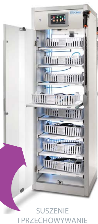
SUSZENIE I PRZECHOWYWANIE

Po tej procedurze, przepłukać i przetrzeć endoskop przy użyciu detergentu INTERCEPT i umieścić zabrudzony endoskop na tacy. Zakryć tacę przy użyciu czerwonej nakładki w celu jasnej identyfikacji endoskopu "ZANIECZYSZCZONEGO".