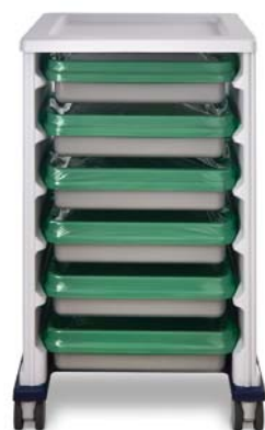
PRZECHOWYWANIE I TRANSPORT ENDOSKOPU GOTOWY DO UŻYCIA U PACJENTA